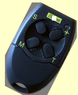
Pupitre de commande radio HF