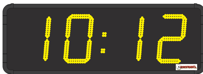
HMT LED 40 cm