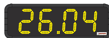
HMT LED 20 cm