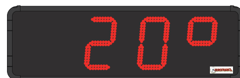
HMT LED 25 cm