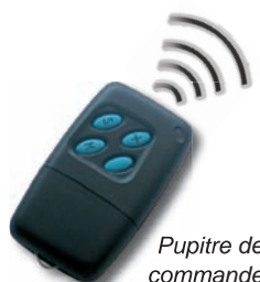
Pupitre de commande radio HF