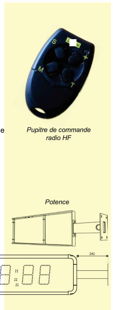
Pupitre de commande radio HF