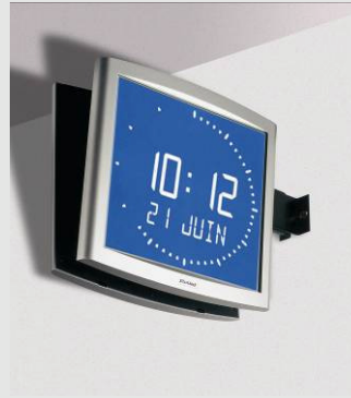
Opalys Ellipse sur support double face