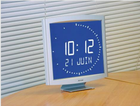
Opalys Ellipse sur support de table